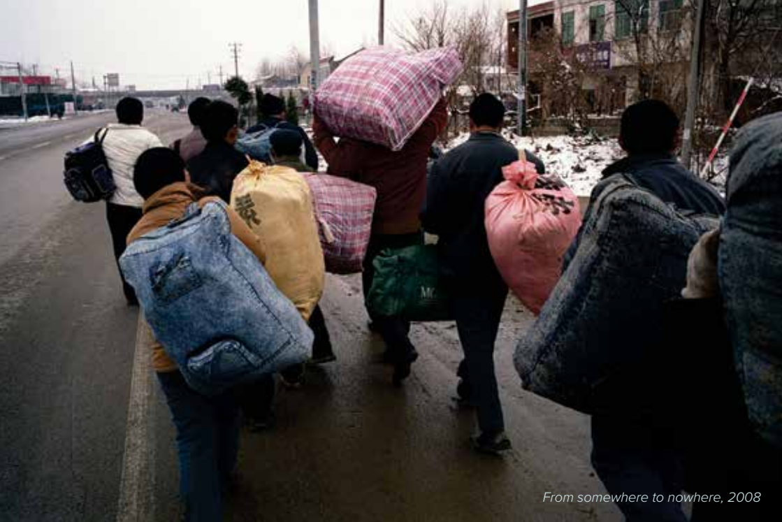
From somewhere to nowhere, 2008

so bili tako Nemci kot tudi ta mladi Švicar, ki na eni strani ni dvomil o tem, da mu je mesto v njegovem malem svetu, a ki se je sočasno počutil tudi vpetega v nekaj veliko večjega, širšega – s samo usodo človeške vrste.